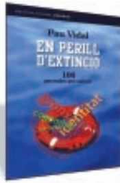
EN PERILL D'EXTINCIÓ Autor: Pau Vidal Edita: Empúries 176 pàgines

L'escriptor (i crucigramista, i traductor) Pau Vidal lliura aquest al·legat contra la pobresa lèxica que amara la llengua catalana per culpa de la desnaturalització a què viu sotmesa. Calcs del castellà i una simplificació del llenguatge promoguda pels mitjans amencen moltes paraules que, tan sols dues generacions enrere eren ben vives. El llibre, doncs, tot i que no té un interès periodístic immediat, sí obliga a una reflexió imprescindible per a tots aquells que publiquen a mitjans de comunicació, en tant que difusors massius de model de llengua. En perill d'extinció és una obra amena i entretinguda que eixamplarà el lèxic del lector o, si més no, l'esperonarà a recupear paraules que ja coneixia, però que mantenia rovellades en algun racó fosc de la memòria.