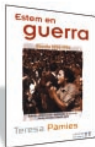
ESTEM EN GUERRA Autora: Teresa Pàmies Edita: Cossetània 216 pàgines